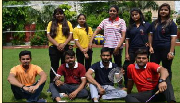
Hostel Sports Club