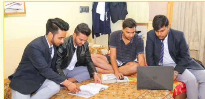
Boys Hostel Room