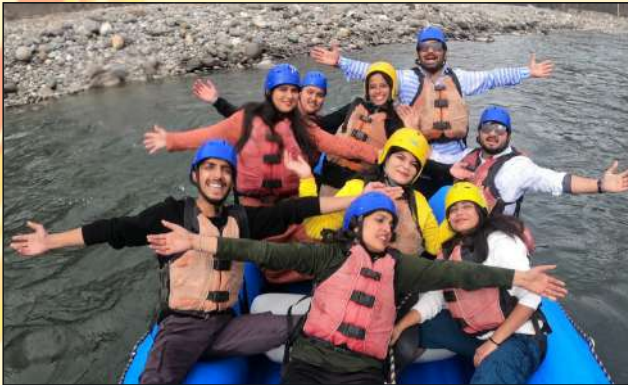
Rafting at Rishikesh