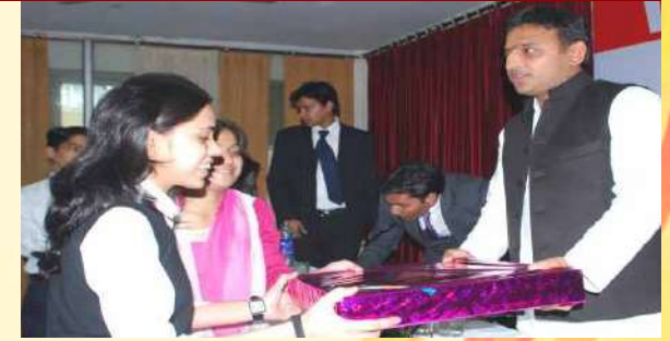
Sh. Akhilesh Yadav Hon'ble Ex. Chief Minister, Uttar Pradesh