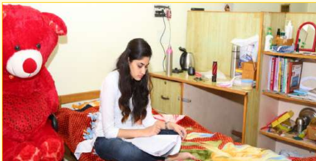
Girls Hostel Room