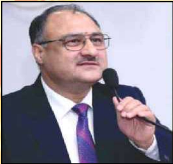
Hon'ble Justice Sh. A.R. Masoodi