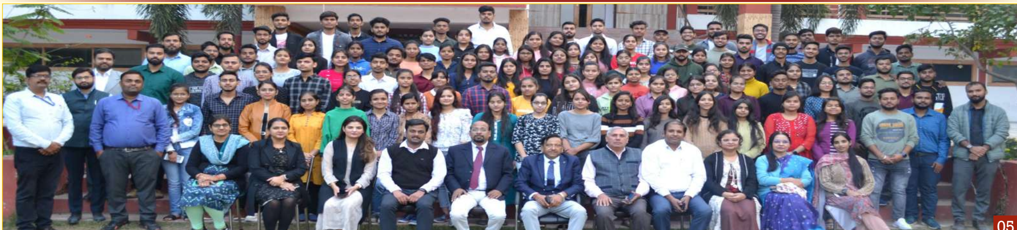
Hostelers With Chairman & Faculty Members