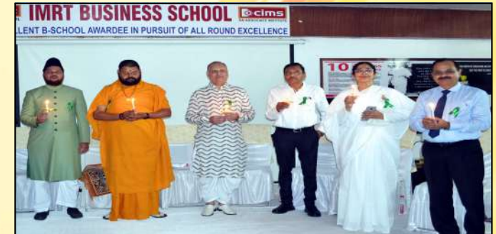
Religious Leaders in Mental Health Awareness Programme at IMRT Business School