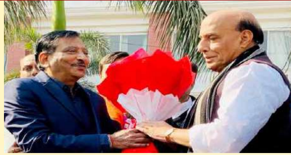
Talk on Good Governance by Hon'ble Rajnath Singh Ji