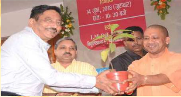
Sh. Yogi Adityanath Hon'ble Chief Minister, Uttar Pradesh