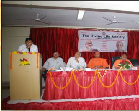
The Divine Life Society