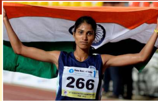
Padmashree Sudha Singh Indian Olympic Athlete