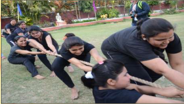
Tug Of War