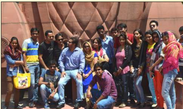
Rock Garden Chandigarh