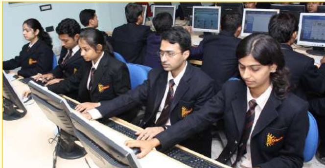
Hi-Tech Computer Lab