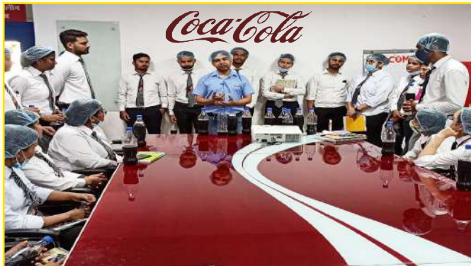
Coca-Cola Plant Visit