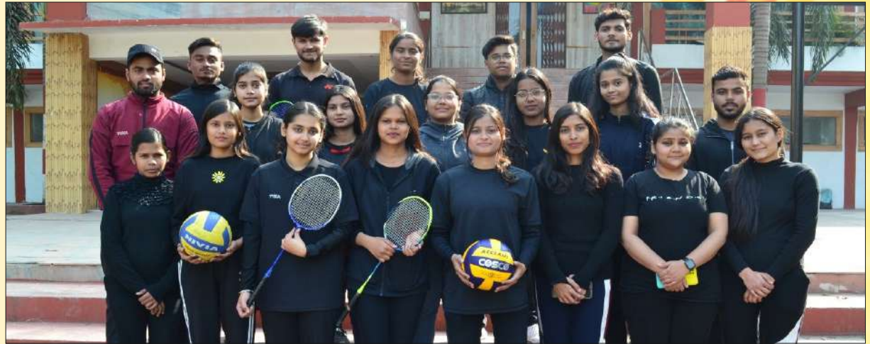
Winners of Sports Events