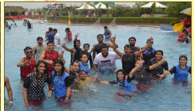
Water Park Visit