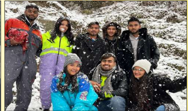
Snowfall at Manali