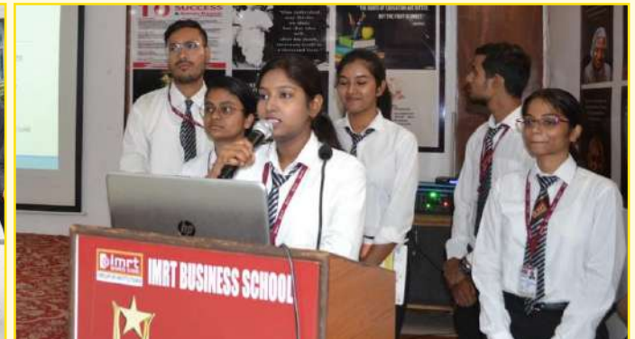
Students Industrial Visit Presentation

02 उत्तर प्रदेश न्याय का प्रहरी ग्लोबल इन्वेस्टर्स समिट में शामिल हुए आईएमआरटी के 650 छात्र